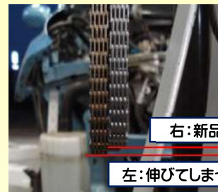
右:新品のチェーン